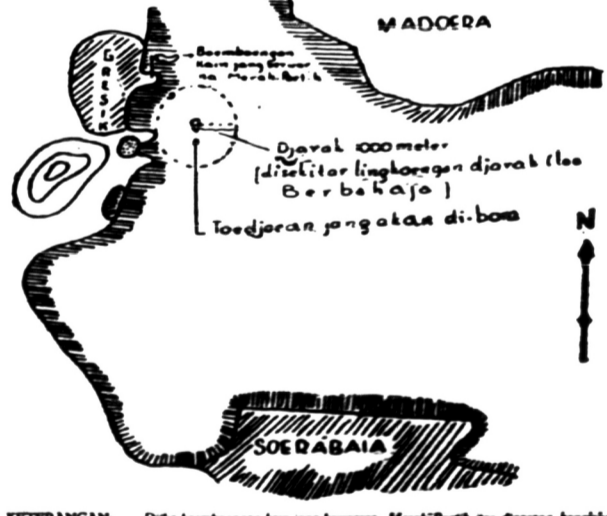
KETERANGAN: Dija bomboangan kain jang berwarna Merah Putih dan dipang, kapal-kapal dan perahu-perahu boleh mendekati atau berhajar di daerah dan di atas laut.