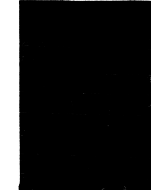
Sebagai telah ditunjukkan dalam surat-surat kabar, bahwa pada hari seperti tersebut di bawah ini, akan diadakan latihan meluncurkan bom dari pesawat terbang. Keterangan lebih lanjut akan terakan di bawah ini. Kepada kapal-kapal dan perahu-perahu jang berhajar di sekitar lingkungan diperingatkan, supaya jangan masuk daerah jang berbahaya. (Lihat tanda dan gambar di peta).